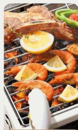
Grilled Fresh Shrimp