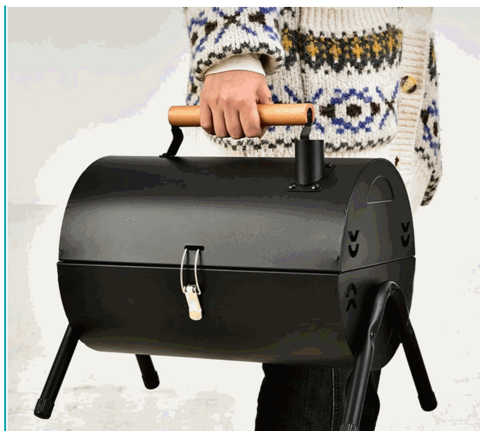
HIGH-END WOODEN HANDLE DESIGN