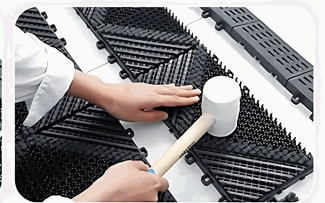
Unir las piezas interiores.