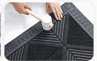
Unir las esquinas.