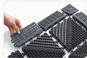
Clasificar los patrones.