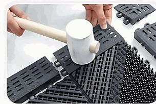
Unir los bordes exteriores.